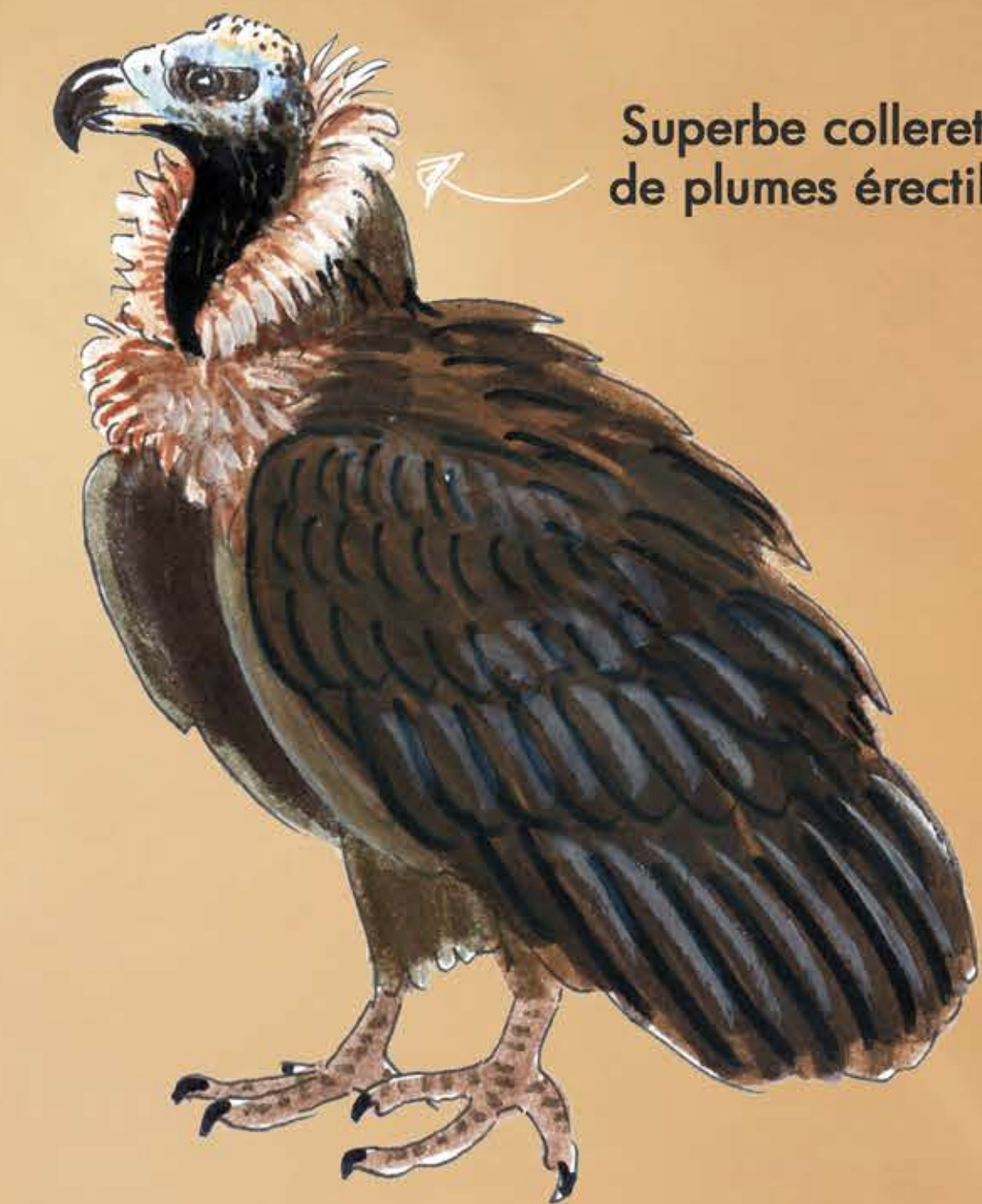
Superbe collerette de plumes érectiles