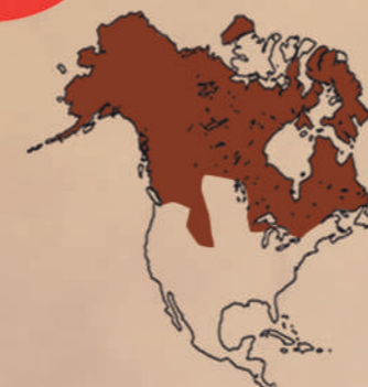
Amérique du Nord